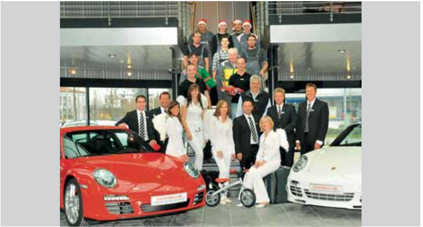
Motiv „Weihnachtsgrüße“ ohne Beschneidung