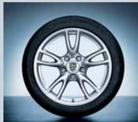
18-Zoll Carrera IV Winterkomplettradsatz Euro 3.516,45***

**Für die 911 Carrera/Carrera S und Carrera 4/Carrera 4S Modelle sowie die Modelle Targa 4/Targa 4S.