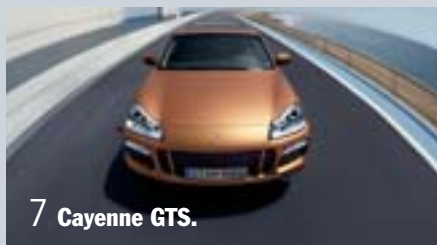
7 Cayenne GTS.