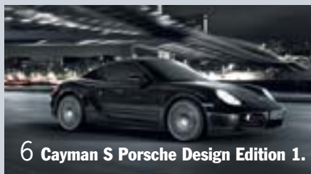
6 Cayman S Porsche Design Edition 1.