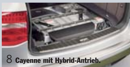
8 Cayenne mit Hybrid-Antrieb.

Porsche Club mit neuem Club-Restaurant. Schlagkräftige Truppe.