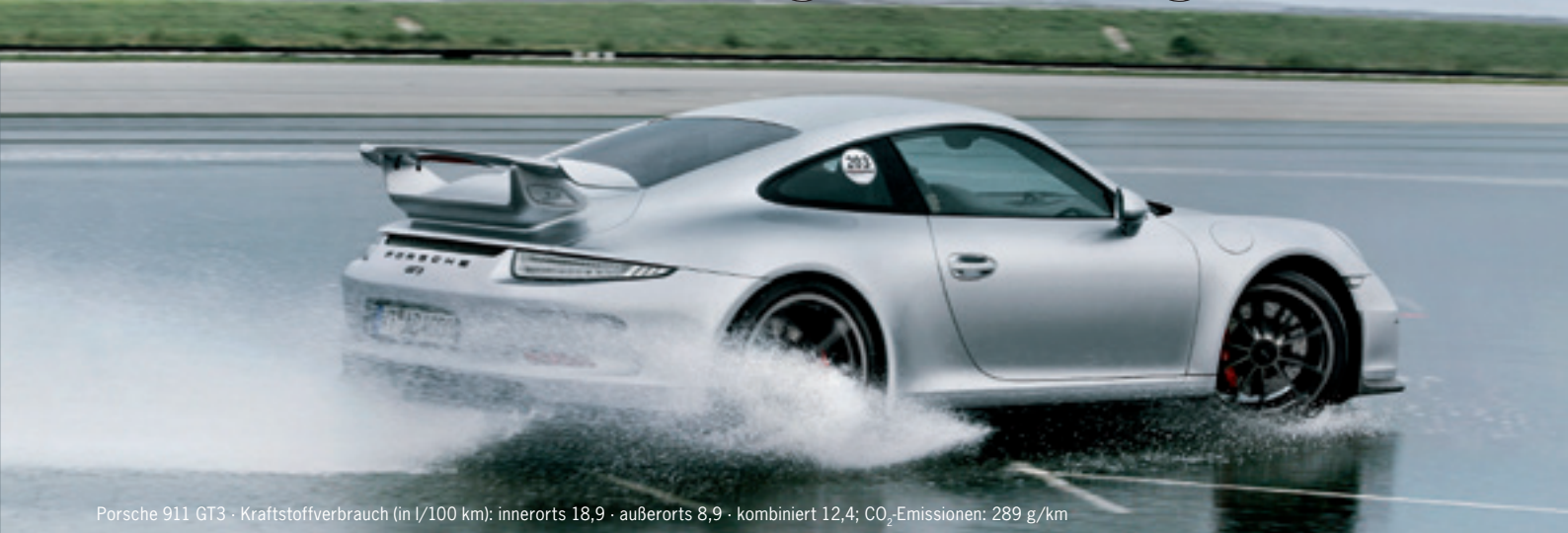
Porsche 911 GT3 · Kraftstoffverbrauch (in l/100 km): innerorts 18,9 · außerorts 8,9 · kombiniert 12,4; CO 2 -Emissionen: 289 g/km

Vom 18. bis zum 19. Juni 2015 laden wir Sie wieder herzlich zum Fahrsicherheitstraining am Lausitzring ein. Erleben Sie eine Fortbildung, bei der Sie lernen, auch in brenzligen Situationen im Straßenverkehr intuitiv die richtigen Entscheidungen zu treffen.