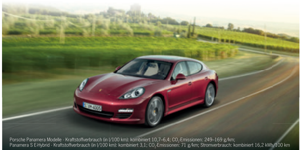
Porsche Panamera Modelle · Kraftstoffverbrauch (in l/100 km): kombiniert 10,7–6,4; CO 2 -Emissionen: 249–169 g/km; Panamera S E-Hybrid · Kraftstoffverbrauch (in l/100 km): kombiniert 3,1; CO 2 -Emissionen: 71 g/km; Stromverbrauch: kombiniert 16,2 kWh/100 km

Bei Fragen rund um unsere Gebrauchtwagen steht Ihnen unser Team telefonisch unter +49 941 70579-0 oder per E-Mail an info@porsche-regensburg.de gerne zur Verfügung.