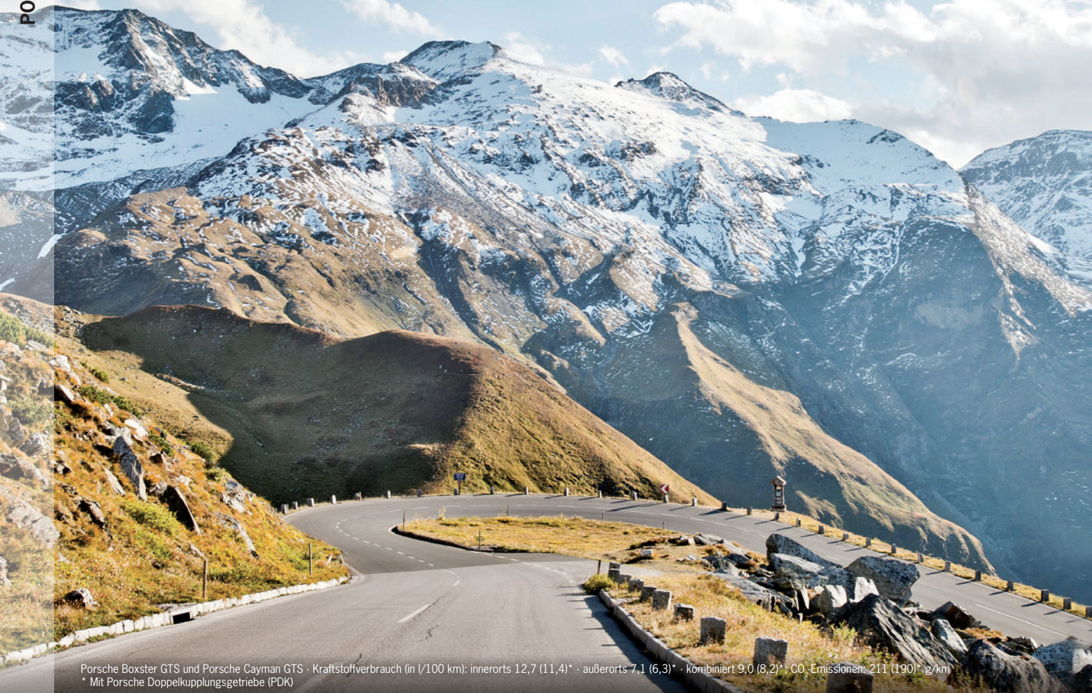
Porsche Boxster GTS und Porsche Cayman GTS · Kraftstoffverbrauch (in l/100 km): innerorts 12,7 (11,4)* · außerorts 7,1 (6,3)* · kombiniert 9,0 (8,2)*; CO 2 -Emissionen: 211 (190)* g/km * Mit Porsche Doppelkupplungsgetriebe (PDK)